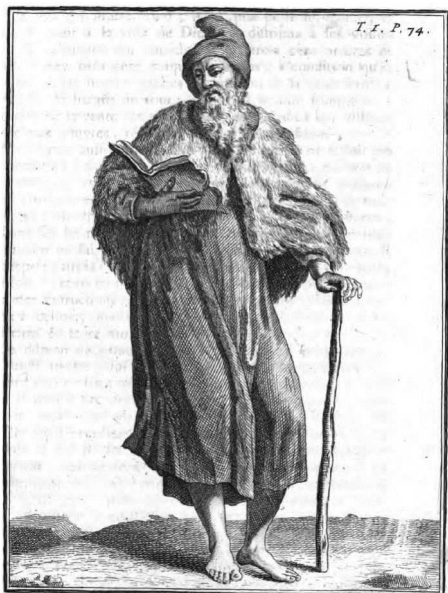
St. Antoine Patriarche des Moines Coenobites

čité době se utáhl do samoty, do pustého hrobu nedaleko města.